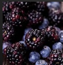
Черника и ежевика